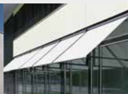
Stores à bras articulés ... et tout autre type de protections solaires