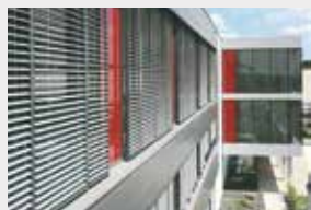
Lamelles orientables avec 2 ou 3 fin de course