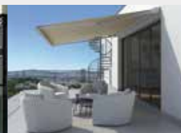
Stores de terrasse