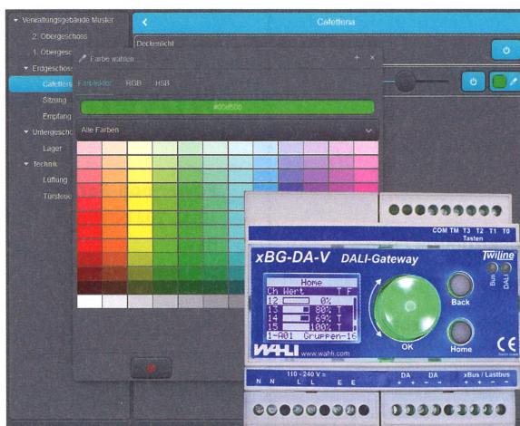
Die relevanten Parameter stehen dem Nutzer auf der Web-App zur Verfügung.

Gleich verhält es sich mit der Regelung von Lichttemperatur und Helligkeit. In einem DT8-Protokoll gebündelt und an das entsprechend ausgerüstete Betriebsgerät versandt, führt das zu angenehmen Tagesverläufen von Lichttemperatur und Intensität der Beleuchtung.